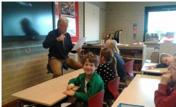
Veurlezen in 't Drents

Spreektaal is namelijk een belangrijk cultuuroord en een talig middel. Het Huus van de Toal is er om de spreektaal te stimuleren. Er werden mooie verhalen verteld en de kinderen konden het over het algemeen goed volgen.