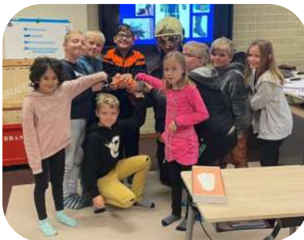
Smokey de rookmelder