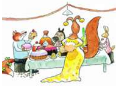
Vos en Haas vieren feest

Op woensdag 9 maart gaan de groepen licht blauw en blauw naar de voorstelling "Vos en Haas vieren Feest". Meerdere groepen van verschillende scholen gaan genieten van deze voorstelling. De voorstelling vindt plaats op een basisschool achter de Albert Heijn, we lopen hier met de kinderen naar toe.